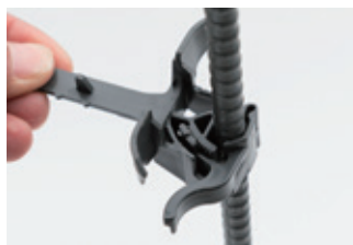
鉄筋径に合わせてしっかり固定。